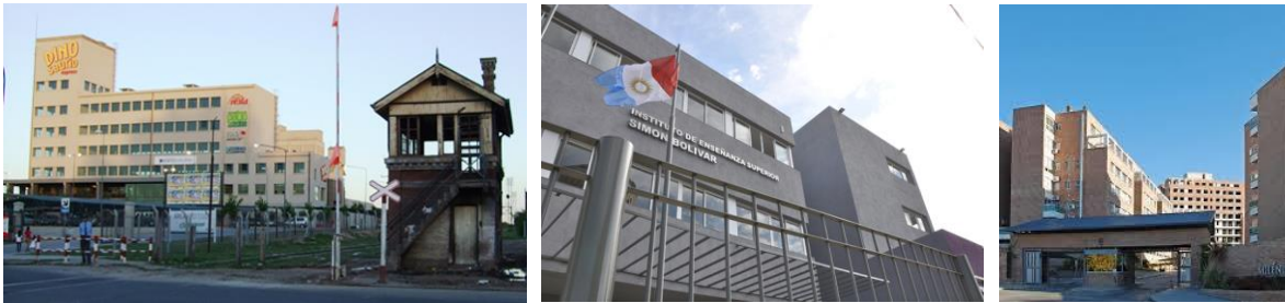
Imagen 2: Dinosaurio Express, Inst. Prov. de Educ. Superior Simón Bolívar; Complejos Milénica. (2015)

En tercer lugar, mientras el Estado regula desigualmente e invierte en mejoras y “recuperación” de terrenos para la inversión privada; parece, sin embargo, desaparecer en términos urbanísticos en territorios no rentables. Esta política de nula inversión para barrios o zonas empobrecidas contrasta con la fuerte inversión en espacios céntricos y emergentes para el negocio de la tierra y del turismo. Así, podemos destacar rápidamente la diferenciación en el cuidado de la costanera del Río Suquía como ejemplo paradigmático: en ciertas zonas se realizan importantes inversiones de iluminación, parquización y construcción, mientras que en otras áreas –como en San Vicente- el río se transforma en un basural 5 .