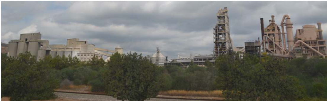
Fig. N°6. Planta de Cemex en Buñol, Valencia.