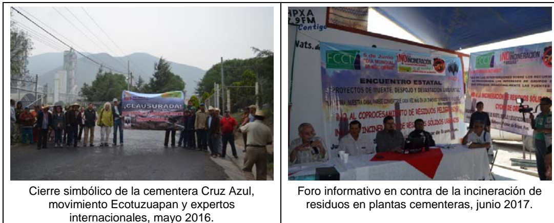
Fig. N°3. Movimiento Ecotuzuapan en Puebla.