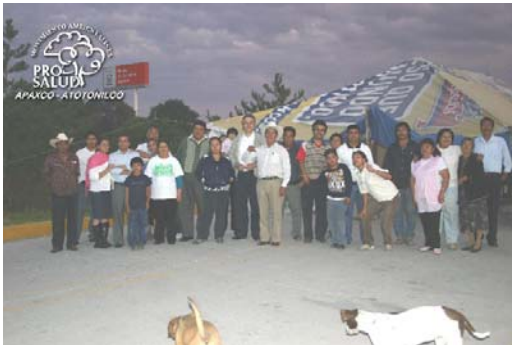
Bloqueo de la planta Ecoltec, Apaxco