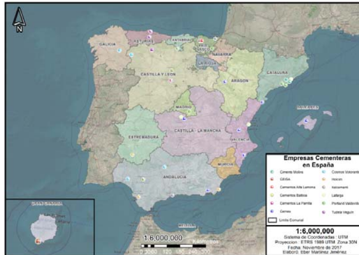
Fig. N°4. Mapa de fábricas de cemento en España, 2017.