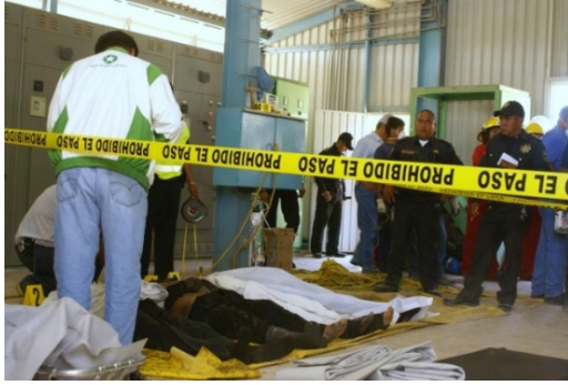
Campesinos muertos por intoxicación de químicos liberados al río por empresa Ecoltec