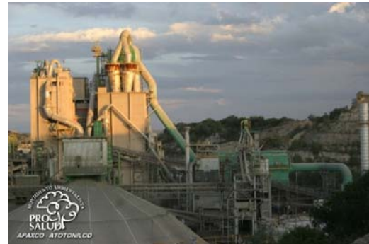
Fábrica de cemento de Holcim, Apaxco