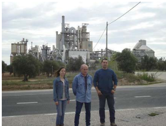
Fig. N°5. Miembros de la plataforma en contra de la incineración de Morata de Tajuña, frente a la fábrica cementera Portland Valderribas, 2017.