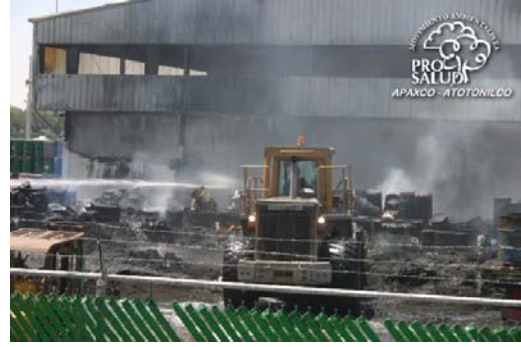
Exposición de residuos industriales en Ecoltec, Apaxco.