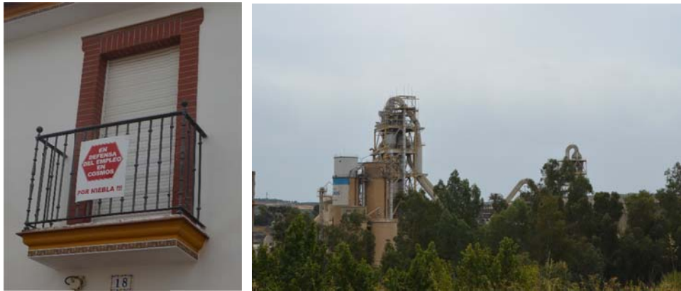
Fig. N° 7. (izquierda) Cartel de protesta 4 . (derecha) Planta de cementos Cosmos Votorantim, Niebla.