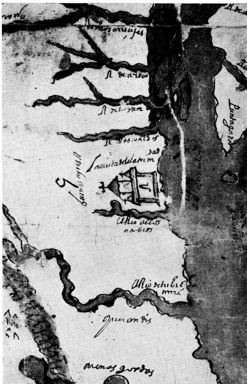
Fragmento del mapa atribuido a Ruy Díaz de Guzmán. Tamaño natural