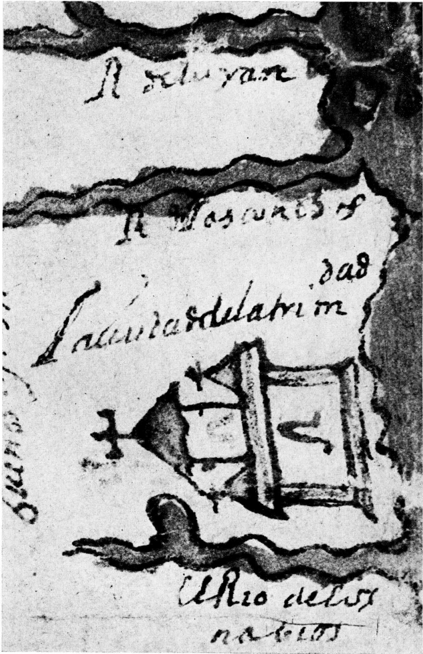
Fragmento del mapa atribuido a Ruy Díaz de Guzmán. Muy aumentado