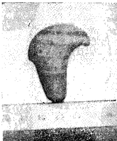
Miniatura votiva (?) de Coipo-Lauquén. (El dibujo, tam. nat.; la fotografía, algo reducida).

Longitud total: 44 mm; ancho: 37 mm; ancho hacia el centro de la prolongación inferior ("mango"): 16 mm; espesor medio: 9 mm.