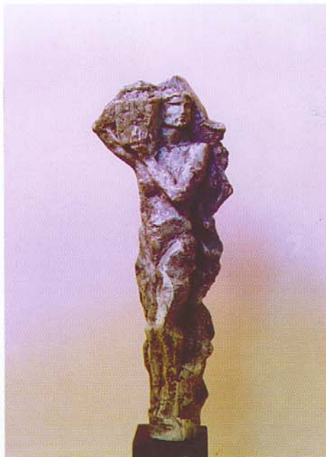
1º Premio "Producto Vitivinícola" 1999