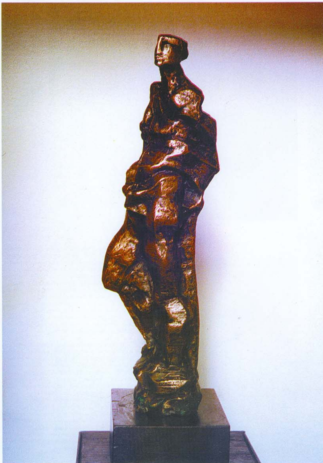
Mujer con paños 1996 Bronce