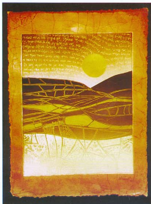
Promesas, 1998 Plastigrafía (xilografía sobre plástico) Sobre papel hecho a mano. 60 x 40 cm

Licenciada en Artes Plásticas, egresada de la Facultad de Artes de la UNCuyo. Máster en Artes Plásticas, en Arizona State University USA, Tesis de Maestría "Grabado sobre papel hecho a mano".