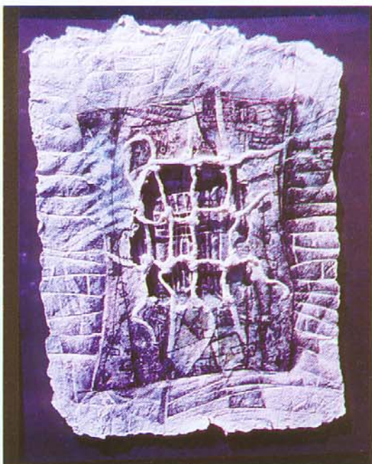
El Paso, 1993 Dibujo sobre papel hecho a mano 60 x 40 cm