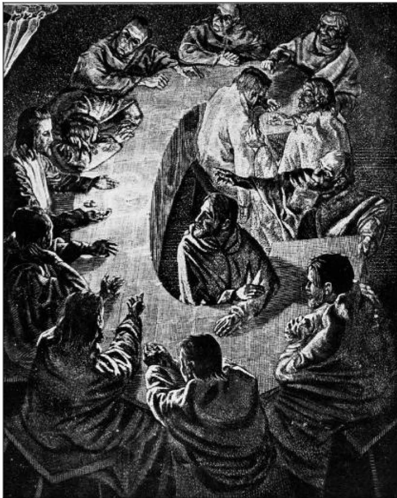
Victor Delhez. La Sagrada Cena.