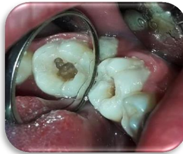
Fig. 3- Eliminación de caries.

Comenzamos con la eliminación de caries con fresa redonda de carburo número 6 (Fig. 3).