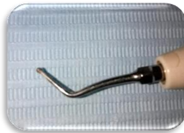
Fig 6- Punta de ultrasonido Woodpecker SB1.

Se procedió a la eliminación de cálculos con ultrasonido (Woodpecker, China), utilizando una punta redonda diamantada SB1 (Woodpecker, China) (Fig. 6) y con una punta periodontal P1 (Woodpecker, China) (Fig. 7), a una potencia de entre 30-50 kHz.