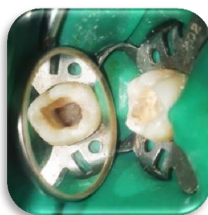
Fig. 9- Localización de conductos.

La preparación de los conductos se comenzó con limas k N° 10, 15 y 20 (Dentsply-Maillefer, Suiza), a la longitud de trabajo determinada con localizador apical (Propex Pixi-Dentsply, Suiza). Entre lima y lima se irrigó con solución de hipoclorito de sodio al 5.25% (Tedequim S.R.L., Industria Argentina). Luego se continuó con la conformación de los conductos utilizando instrumental rotatorio Mtwo (VDW, Alemania) accionadas con motor de endodoncia Silver Reciproc® (VDW, Alemania). Para los conductos mesiales se usaron las limas en el siguiente orden secuencial, 10/04, 15/05, 20/06, 25/06. Lo mismo se utilizó para la conformación del conducto distal, y se agregó una última lima Protaper Next calibre 30/06 (Maillefer, Suiza). Siempre realizando abundante irrigación con hipoclorito de sodio al 5,25% entre el paso de limas.