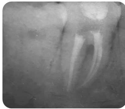
Fig. 13- Radiografía Final.

Se procedió a terminar de obturar con la técnica de condensación lateral y los conos fueron cortados con calor. Se realizó radiografía periapical final (Fig. 13).