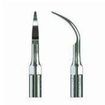
Fig. 7- Punta P1 (Catálogo Woodpecker).