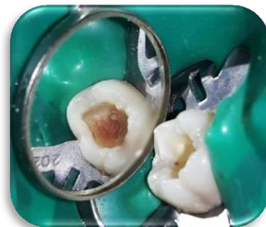
Fig. 4- Aislamiento Absoluto.

Se realizó aislamiento absoluto (Fig. 4) con goma dique (Dental Dam- Sanctuary) y clamp N°202 (Ivory). Finalizada la apertura cameral, se observó la presencia de cálculos pulpaes en el piso de la cámara que impedían la localización de los conductos (Fig. 5).