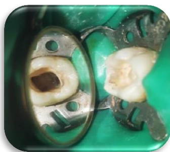
Fig. 8- Eliminación completa del cálculo

Se eliminaron completamente los cálculos (Fig. 8), se procedió a la localización de conductos y preparación de los mismos (Fig. 9).