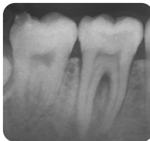
Fig. 2- Radiografía periapical

Para el examen radiográfico se realizó una radiografía periapical (Película Dental Intraoral Kodak Velocidad E (E Speed)) (Fig. 2) donde se observó en elemento 36 una imagen radiolúcida debajo del esmalte (compatible con caries), ensanchamiento del ligamento periodontal, radiolucidez en la zona de furca y calcificaciones intracamerales.