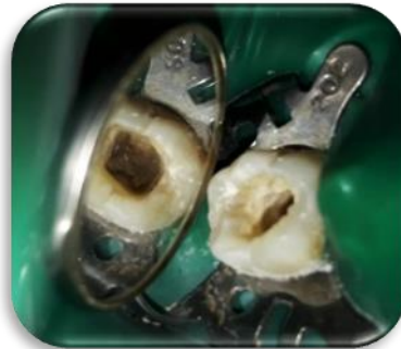
Fig. 5- Apertura cameral, presencia de calculos intracamerales.

Se procedió a la eliminación de cálculos con ultrasonido (Woodpecker, China), utilizando una punta redonda diamantada SB1 (Woodpecker, China) (Fig. 6) y con una punta periodontal P1 (Woodpecker, China) (Fig. 7), a una potencia de entre 30-50 kHz.