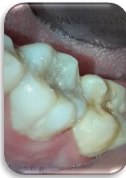
Fig. 1- Examen clínico. Inspección

Al examen clínico (Fig.1) se observa en el elemento 36 una translucidez en el esmalte, compatible con caries. A los test de sensibilidad responde positivamente al frío (Kleep Ice, Grinberg dentales S.A. Industria Argentina) y percusión.