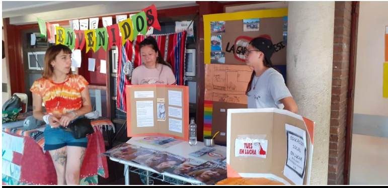
Figure 23: Clase pública de "Proyectos Socioeducativos"