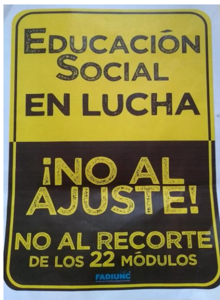
Figure 17: Folleto realizado en conjunto con FADIUNC