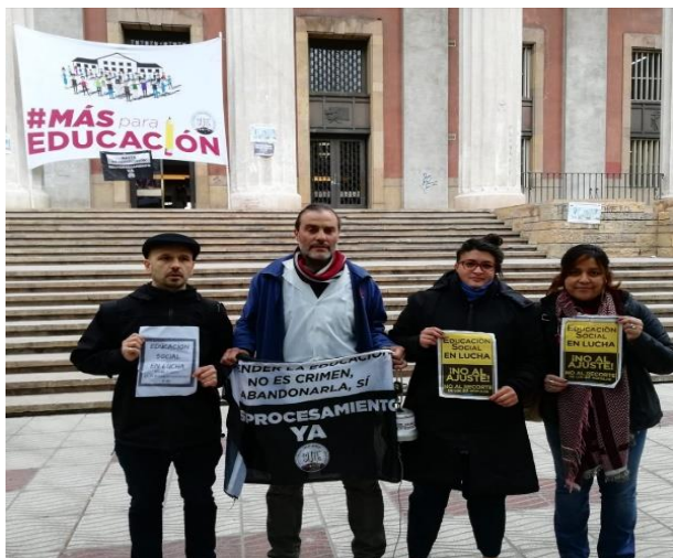
Figure 5: LA TERRE, Fábrica Recuperada.