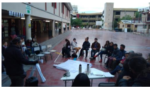
Figure 18: Clase pública de Praxis 5