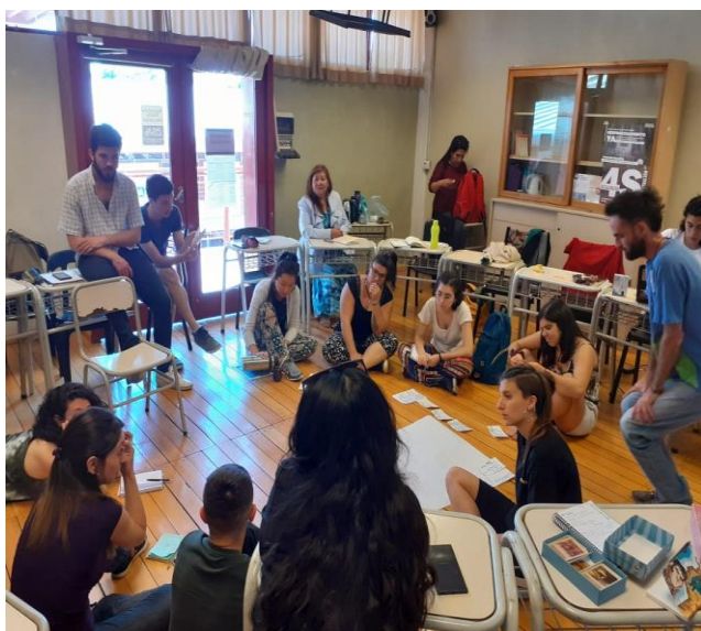
Figure 7: Trabajando en el Pre-Encuentro

Podemos encuadrar en conceptos teóricos las prácticas de varixs. Y cuando estábamos bien tristes por las dificultades de la lucha, ¿tuvimos una clase muy linda en Psicología Educacional donde trabajamos desde lo grupal, pero desde lo teórico? Sí y no. No y sí. Porque dialogamos, pusimos en palabras lo que nos pasaba, la frustración y la energía que se agotaba por momentos, pero logramos identificar que la convicción de sostener la lucha seguía intacta, porque era algo que nos atravesaba el cuerpo y constituía nuestra realidad y contexto y no podía quedarse por fuera de lo educativo. Todos estos nuevos conceptos que aprendíamos no podían quedar aislados de lo que nos sucedía. Pero bueno, ese es otro aprendizaje de esta Tecnicatura de Educación Social, no necesitamos confrontar teoría y