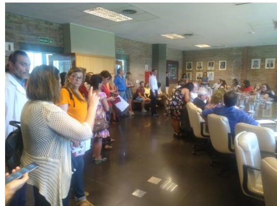
Figure 3: Primera Presencia en el Consejo Superior UNCuyo

En ese marco, se desarrolló una clase pública de Sociología de la Educación, donde aprendimos los distintos paradigmas desde los cuales nos podemos posicionar para ver la realidad. Es decir, desde qué “gorros” podemos analizar e interpretar el desarrollo de los hechos.