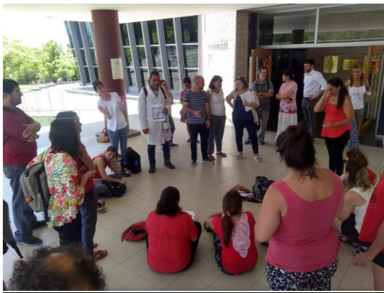
Figure 14: Asamblea para definir como continuar la lucha en el CS