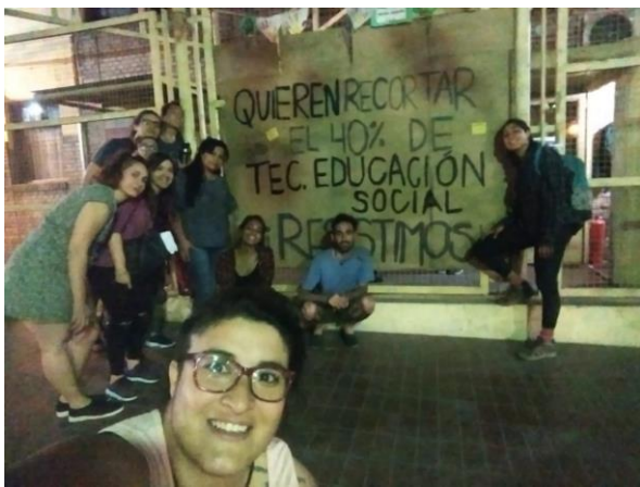
Figure 22: Intervención artística de "El Colectivo"