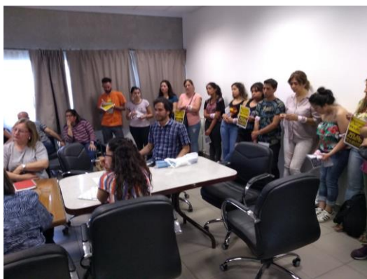
Figure 19: Consejo Directivo de la FED