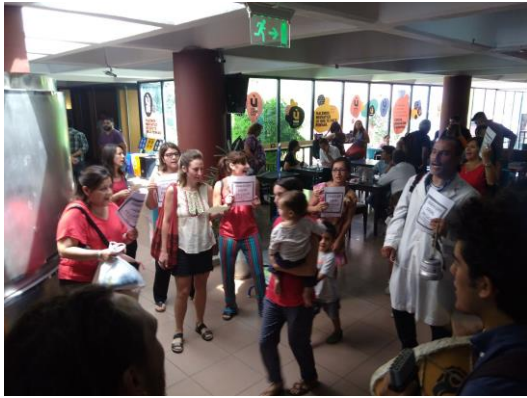
Figure 13: Intervención artística en Consejo Superior