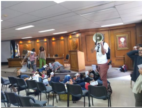
Figure 24: Intervención artística en la Facultad de Filosofía y Letras