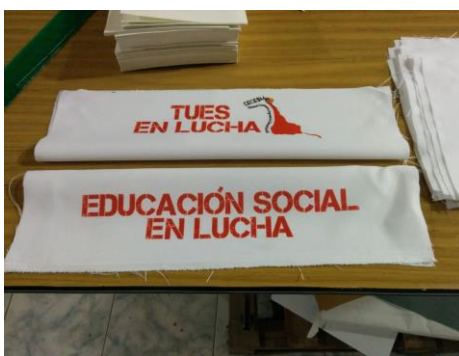
Figure 15: Distintivo realizado por "El Colectivo"