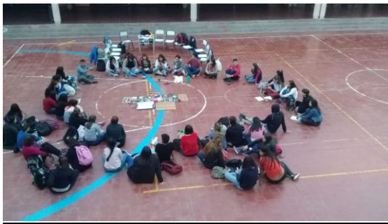
Figure 20: Clase pública de Pedagogía