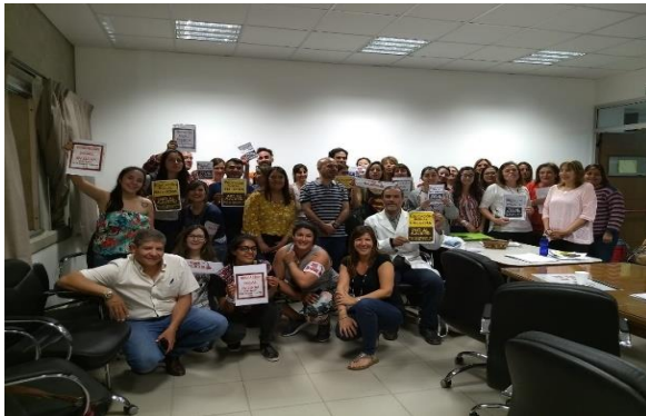
Figure 2: CD Cuando se logra presentar la oposición en el Consejo Superior