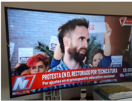
Figure 21: Cobertura de Canal 7 en el Consejo Superior