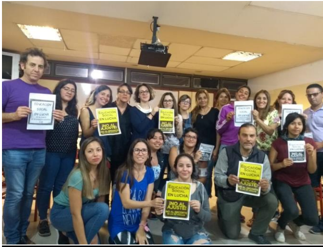
Figure 16: Curso de Primer año en "Praxis I"