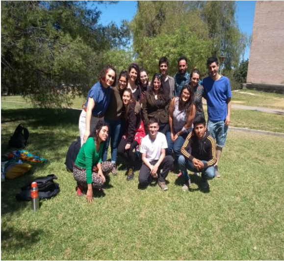
Figure 8: Cierre del Pre-Encuentro

El día en que todo comenzó: Los estudiantes secundarios y universitarios de nuestro vecino país se organizaron para evadir masivamente el pasaje del metro de Santiago. La razón, una protesta al alza en el valor del pasaje por 30 pesos chilenos. Un euro es equivalente a 881 pesos chilenos, casi el valor de un tiquete de metro.