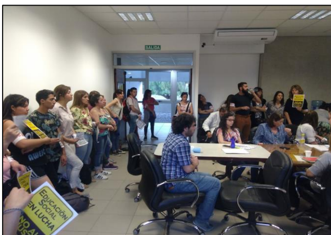
Figure 1: Primera visita al Consejo Directivo de la FED

Fue así como estas herramientas teóricas nos fueron ayudando a entender a la institución educativa, pero no en el cuaderno; sino en los edificios, en las personas, en sus cuerpos, en el Consejo Directivo y en el Superior (UNCuyo). Es ahí donde se abre otro capítulo, en nuestra primera visita al Consejo Directivo. Cuando decimos “nuestra” nos referimos al Colectivo de Estudiantes y Egresades de Educación Social y docentes, con quienes empezamos a construir una identidad conjunta (proceso más que interesante en término de roles en la