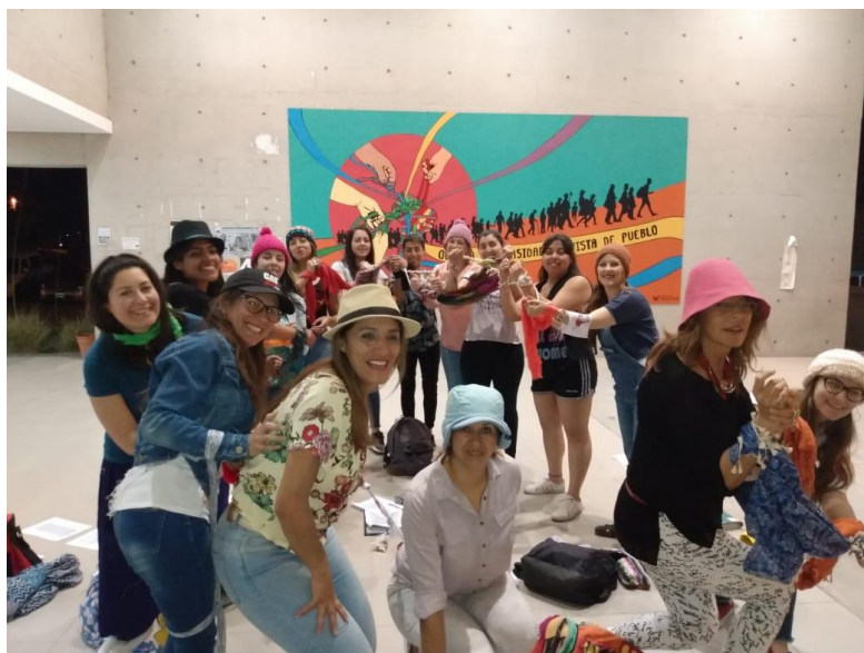
Figure 4: Clase Publica de "Sociología de la Educación"

La clase pública surge en el marco de una reunión del Consejo Directivo de la Facultad de Educación donde se trataba la situación de la TUES; se realizó en el espacio abierto del edificio nuevo recientemente inaugurado. La consigna fue asistir ordenadxs en grupos, con gorros, pañuelos de cuello o bufandas, y también almohadones o mantas para permanecer en el piso. El espacio físico nos sirvió para imaginar el campo científico como espacio de lucha, de enfrentamiento entre grupos de interés que se posicionan en distintos lugares del espacio; así ocupamos alternativamente el límite este del espacio, o giramos hacia el sur, mientras otrxs se quedaban en el centro... en algunos lugares se sentía más frío y se podía observar la montaña, pero en otros se sentía más cálido y quedaba a la vista solo la cinta asfáltica y la parada del micro; los gorros y pañuelos nos permitían ver algunas partes del paisaje, pero no otras. Trabajamos un texto de Ana María Brigido (2006) donde afirma: