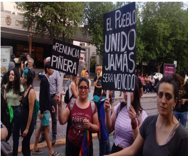
Figure 9: Marcha en apoyo al pueblo chileno

La radicalización del movimiento: en tan solo una semana, las protestas escalaron y comenzó la destrucción del metro y la suspensión del servicio . La policía chilena empezó a repeler a