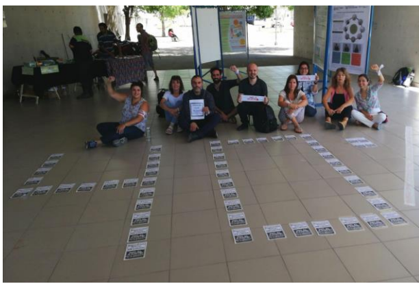
Figure 25: Intervención Artística en la puerta de la FED.