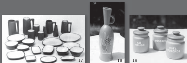
17- Juego de Gres Cerámico Bled. 18- Botella para vino de Oyarce. 19- Especieros de Oyarce.

Desde el punto de vista tecnológico, el mejor ejemplo de diseño que permaneció por más de treinta años, es el de Gres Cerámico Colbo, de la elogiada arquitecta y ceramista Colette Boccara. La tecnología 11 que utilizaba era