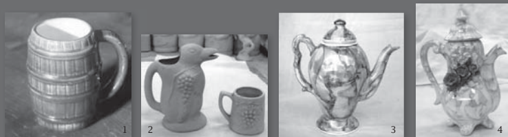
1. Chop de Korotán. 2. Pingüino y chop de Blanca López. 3. Tetera marmolada de Caces. 4. Tetera decorativa de Blanca López.

Según el Prof. Ochoa 2 , la industria cerámica mendocina creaba objetos que podían ser considerados artesanales debido a las características de su tratamiento manual y también por la intervención de equipos fabriles poco evolucionados. Pero, por tratarse de una producción más bien reducida, se la debería considerar artesanía semi-industrial. Para Aquiles Gay y Bulha: "en la producción artesanal no se plantea un proceso de preconcepción sistematizada, mientras que en la producción industrial, sí" 4 . Es importante destacar a la fábrica Caces, dedicada, casi en un 90% a la producción de vajilla con gran variedad de productos y gran cantidad de modelos. Famosa por el marmolado y el esmaltado blanco brillante que daba a sus piezas y conocida como la fábrica de los yugoslavos, por la procedencia de quienes eran sus dueños.