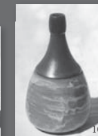
13- Platos de Gres Cerámico Colbo. 14- Taza de café y plato de Gres Cerámico Colbo. 15- Juego de gres de Maraño. 16- Botella para aceite de Maraño. Primer premio Salón Cerámica de Cuyo, sección funcional, categoría vocacional, 1985.