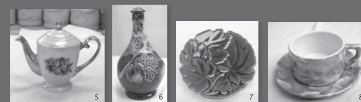
5. Tetera con filete de oro de Sacla. 6. Botella de vino de Nápoli y Completa. 7. Tapa decorada en relieve de Nápoli y Completa. 8. Taza cilíndrica y plato marmolados de Nápoli y Completa.