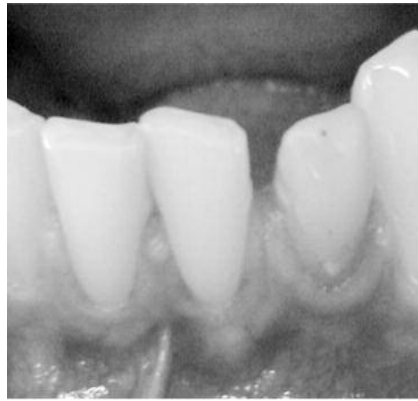
Foto 4. Elemento restaurado.

de la pieza y su restauración coronaria 6 . Según los preceptos de la Odontología Mínimamente Invasiva se conservó la mayor cantidad de tejido dentario sano, se eligió el tamaño del poste de fibra de vidrio adecuado para la porción radicular