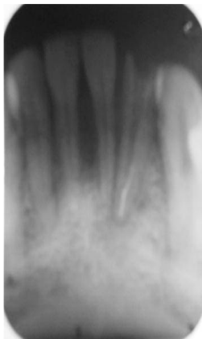
Foto 2. Ensanchamiento del conducto. Nótese el sellado de la falsa vía.