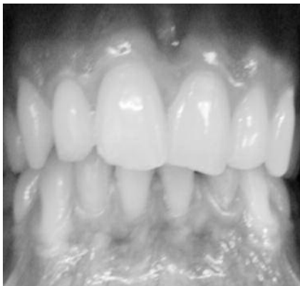
Foto 3. Elemento dentario en oclusión.