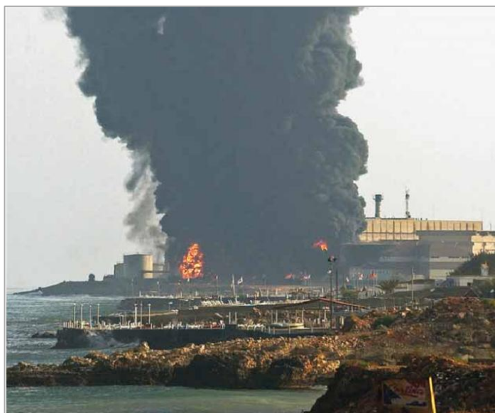
Incendio de los tanques de petróleo en la planta Jiyeh (Líbano), julio de 2006. Entre 10.000 y 15.000 ton. de petróleo fueron derramados al Mar Mediterráneo.

Israel también sufrió graves daños ambientales -si bien menores que Líbano-, expresando que “Va a demorar 50 años, dos generaciones enteras, para que nuestros bosques vuelvan a ser como eran antes de la guerra”. En total, según el informe difundido por la organización,