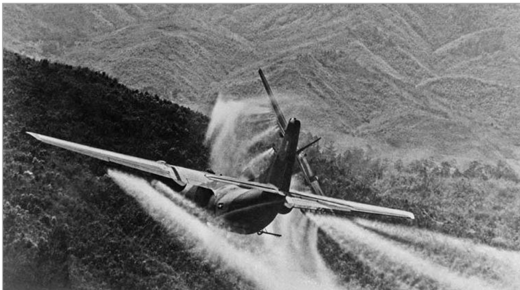
El herbicida Agente Naranja fue esparcido en amplias áreas durante la guerra de Vietnam, trayendo graves consecuencias medioambientales y sanitarias.

El art. 2 explica que los daños al medio ambiente prohibidos en la Convención son los que resultan del uso de “todas las técnicas que tienen por objeto alterar -mediante la manipulación deliberada de los procesos naturales- la dinámica, la composición o estructura de la Tierra (...)”.