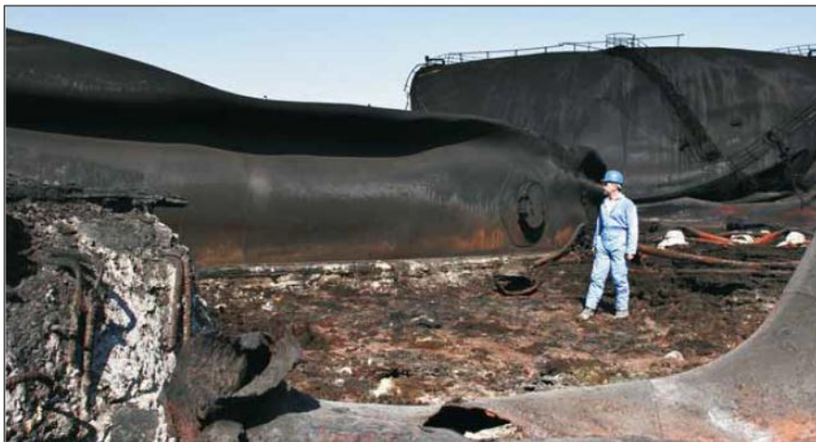
Experto de UNEP investigando uno de los tanques de almacenamiento dañados en la planta Jiyeh, 2007.

El 17 de agosto de 2006, la Organización Marítima Internacional y el PNUMA se reunieron en Atenas y acordaron el plan de acción para asistir a las autoridades libanesas con la limpieza. Los daños directos derivados del bombardeo de la central se estimaron en US$ 139,6 millones, y el coste de las tareas de limpieza en US$ 65 millones, las cuales pudieron contener la contaminación masiva de casi todo el litoral libanés.