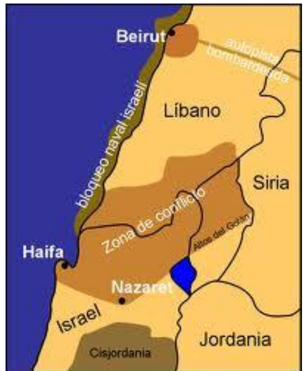
Zona de conflicto guerra Líbano-Israel 2006.

En horas de la mañana de ese día, dos vehículos blindados del Ejército Israelí que patrullaban la frontera con el Líbano, fueron atacados por una emboscada de Hezbollah, en la que murieron tres soldados y otros tres resultaron heridos (uno de ellos de gravedad), y otros dos fueron tomados prisioneros. Paralelamente, y como método de distracción, la organización armada bombardeó asentamientos civiles del norte de Israel con cohetes, hiriendo a cinco civiles. El propio Hasan Nasrallah, máximo líder de la organización islamista, había señalado tiempo atrás la intención de Hezbollah de capturar a soldados israelíes, después de que el ex primer ministro Ariel Sharon incumpliera la ratificación de los acuerdos acerca de la liberación de todos los prisioneros de Hezbollah durante el último intercambio de prisioneros entre Hezbollah e Israel.