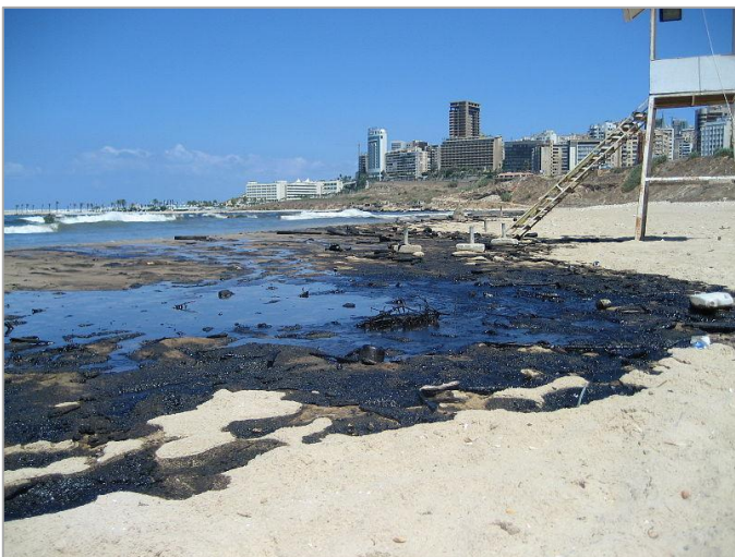
Petróleo de la central eléctrica de Jiyeh desparramado en las playas de Beirut, consecuencia del conflicto Israel-Líbano, Agosto 2006.

Esas dos disposiciones fueron fruto de los trabajos de la Conferencia Diplomática sobre la Reafirmación y el Desarrollo del Derecho Internacional Humanitario Aplicable a los Conflictos Armados; su existencia demuestra la toma de conciencia de la importancia del