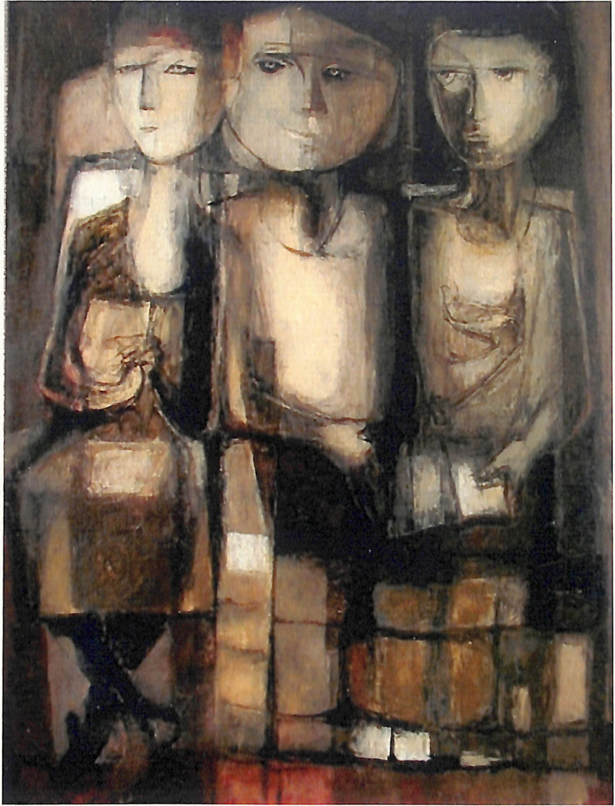
Antonio Sarelli, Diálogo de Duendes , óleo sobre tela, 1964