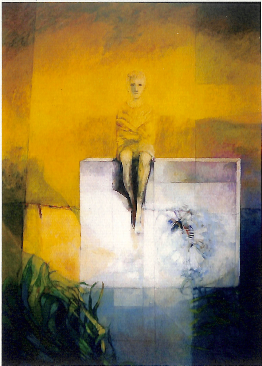
Antonio Sarelli, Dimensión del Silencio , óleo sobre madera, 1985