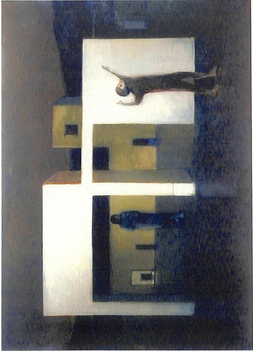
Antonio Sarelli, Dimensión Blanca , óleo sobre tela, 1968